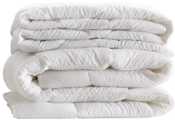
Couette double saison Rembourrage Dacron

Rembourrage Fiberfill, composé de 2 inserts couplés pouvant être utilisés séparément. Dimensions mm : l 2000-2500-2800 p 2000.