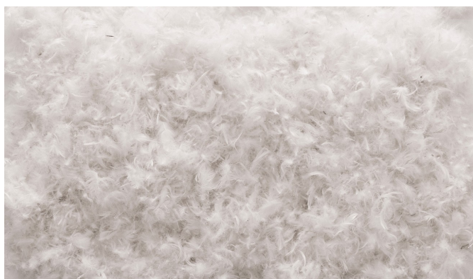
Oreiller en duvet d'oie

Rembourrage 80% duvet d'oie et 20% duvet d'oie stérilisé. Les capacités respirantes élevées garantissent une température de repos uniforme. Il absorbe l'humidité et favorise l'évaporation de l'excès de chaleur. Doublure 100% coton amovible et lavable.