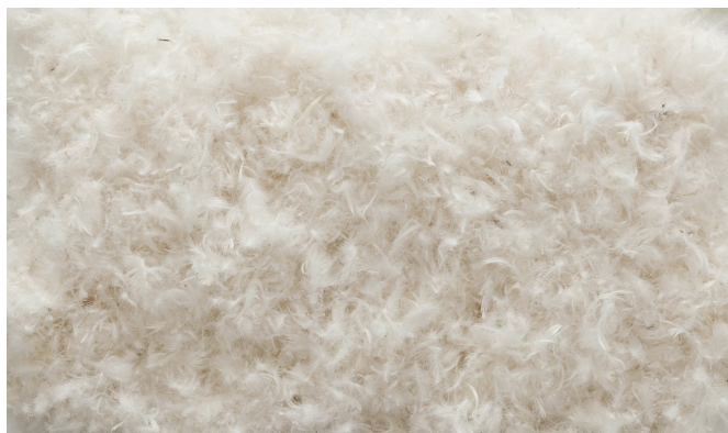
259 / 5.000 Risultati della traduzione Oreiller en duvet d'oie

Rembourrage 100% duvet d'oie stérilisé. Les capacités respirantes élevées garantissent une température de repos uniforme. Il absorbe l'humidité et favorise l'évaporation de l'excès de chaleur. Doublure 100% coton amovible et lavable.