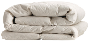
couette 50/50 plumes

Garnissage 50% duvet, 50% plumes d'oie / canard de gr. 325 / m 2 , doublure 100% coton. Dimensions mm : l 2000-2500-2800 p 2000.